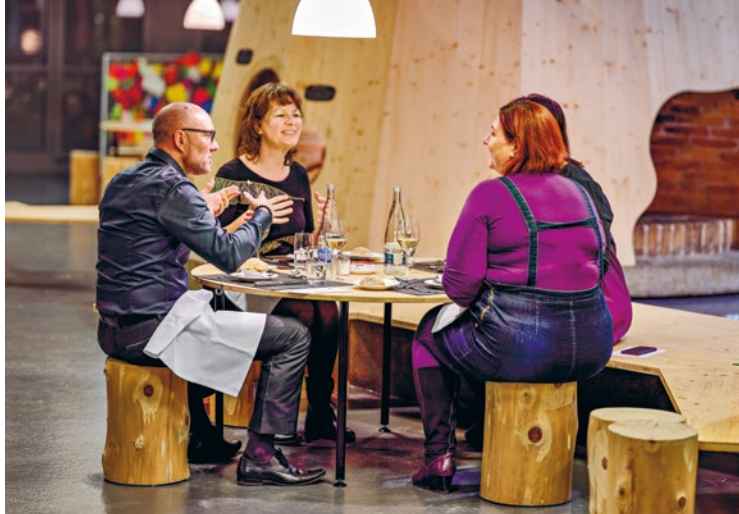
Tables éphémères aux musées

atelier a affiché complet et 40 jeunes filles y ont participé. Elles ont pu rencontrer et échanger avec les différentes personnes actives dans la conception et la réalisation de l'exposition sur les arbres (médiatrice, graphiste et scénographe, ingénieur...). Elles ont ensuite réalisé un petit montage électrique inspiré d'un module de l'exposition. La journée a été un beau succès.