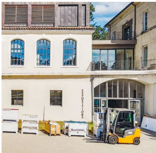
Chargement de Manivelles & Roues dentées aux Clévos

présentées au centre culturel des Clévos, France ( www.lesclevos.com ) de janvier à juillet.