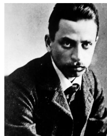
L'œuvre de Rilke est honorée à la Maison Visinand.

Depuis Lord Byron mettant en vers son prisonnier, le château de Chillon est un emblème du romantisme dont les «Journées» s'emparent très logiquement. L'exposition «Boutons, lacets et sous-vêtements: comment faisait-on au Moyen Age?» dégrafe la question ce jeudi (17 h 30) et ouvre le 4 e round de ce week-end exalté, où le romantisme se conjugue sur toutes les intensités et sous tous ses genres. Montreux prend le relais ce jeudi à 19 heures, avec là aussi des histoires de frous-frous: «de sous-vêtement dans tous ses états» se visite à la Bibliothèque municipale (19 h). Le lendemain, le Conservatoire de musique accueille Loris Sevhonkian pour un récital de piano «en clair-obscur» qui honore Mozart, Rachmaninov ou Schubert. Samedi à 14 h, les Mélodies Passagères chantent et jouent au violoncelle des œuvres de Prokofiev ou de Chostakovitch, à la Maison Visinand. Dimanche à 17 h,