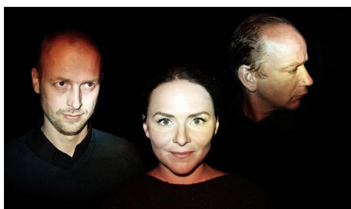
Emiliana Torrini et ses deux Colorists, samedi à Lausanne.

Lausanne, Docks Samedi (20 h 30) Loc.: Fnac, Starticket et petzi.ch www.docks.ch