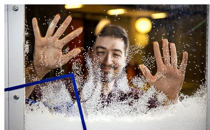
En frottant la paroi de plexiglas, on peut bouger les billes de saïex sans les toucher: elles se chargent en électricité suite au frottement et attirent ou repoussent d'autres objets chargés.