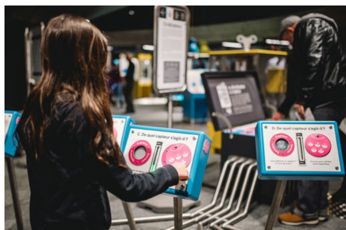
↑ ↑ Vues de l'exposition Robot .

Quand on dit « robot », la plupart d'entre nous pense probablement à C-3PO dans Star Wars ou à Optimus Prime dans Transformers . Les dessins animés, le cinéma et la littérature fourmillent de robots humanoïdes, créés à l'image de l'humain.