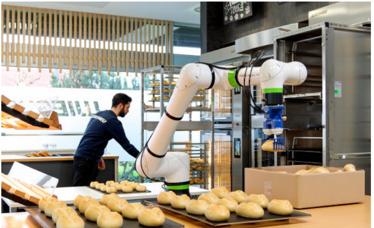
Bras robotique collaboratif de l'entreprise Fanuc

Les robots industriels atteignent une vitesse d'exécution record et font preuve d'une précision inouïe. En 2021, environ 3,5 millions de robots industriels étaient fonctionnels dans le monde. Mais comment fonctionne un bras industriel qui a pour mission de mettre des chocolats dans une boîte ? Visiteurs et visiteuses sont invité·e·s à explorer l'algorithme qui dicte les actions de ce type de robot.